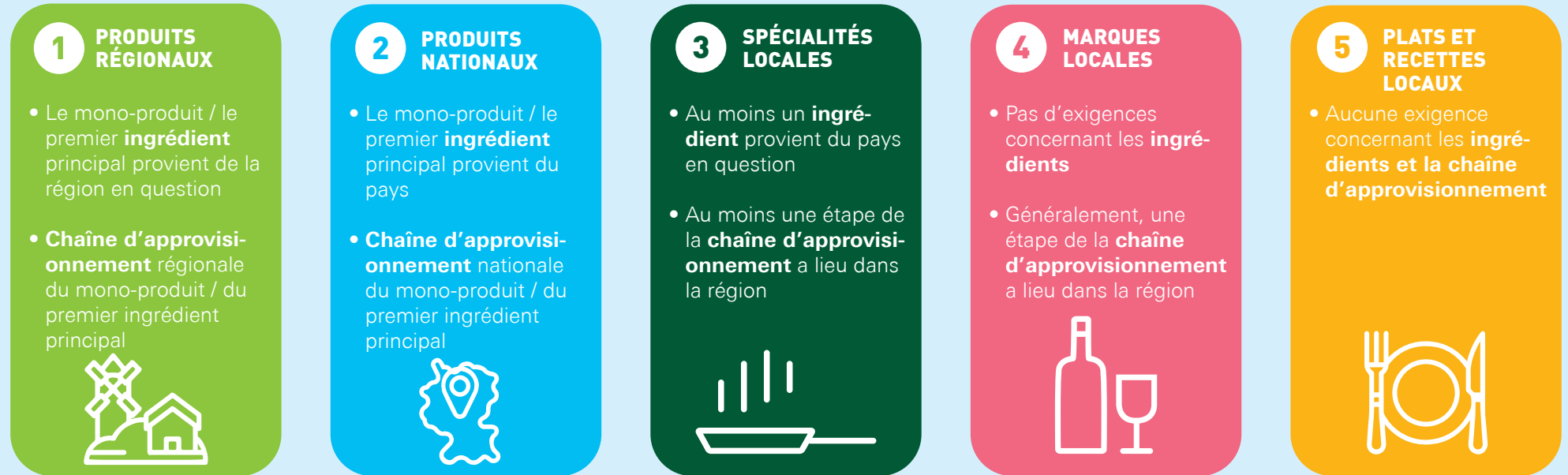
Illustration 1 : Modèle à 5 colonnes de ce que sont les produits alimentaires locaux pour ALDI Nord : une vue d'ensemble

D'un point de vue du développement durable, ALDI Nord préfère les produits régionaux et nationaux (colonnes 1 et 2) aux spécialités locales et aux marques locales (colonnes 3 et 4), car les premiers contribuent de manière plus globale à une consommation respectueuse de l'environnement. Nous nous concentrons donc sur l'offre d'articles régionaux et nationaux. Dans les pays ne disposant que de petites gammes de produits régionaux, les articles nationaux sont prioritaires, suivis par les offres de spécialités et de marques locales.