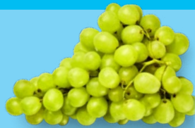
Pitloze witte druiven