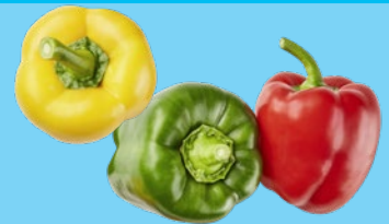
Mélange de poivrons