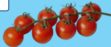
Tomates cerises en grappe