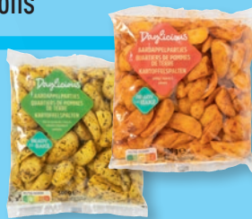
Pommes de terre épicées