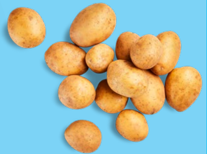
Pommes de terre